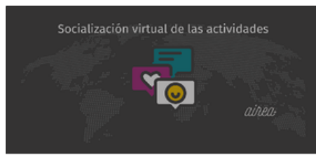
Soluciones creativas con aplicaciones digitales Cómo hacer que el conocimiento sea común

Se proponen algunas herramientas, para socializar y reflexionar sobre el conocimiento como bien común desde la importancia de la socialización, el acceso y la co-creación.