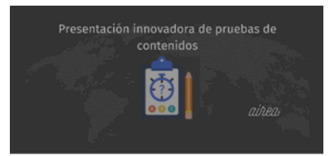
Soluciones creativas con aplicaciones digitales Alternativas creativas a los exámenes tradicionales

Se exploran diversas soluciones a problemas cotidianos del proceso de enseñanza aprendizaje a partir del uso de herramientas digitales, dando importancia a lo visual, audiovisual, secuencial y otros.